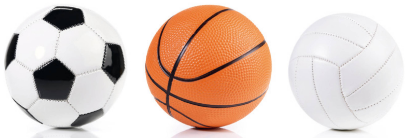
Ähnlich, aber nicht gleich: Was muss bei der Berufsbezeichnung beachtet werden? | Semblable mais pas identique: quelles exigences pour quel titre professionnel? | Simile, ma non uguale: cosa bisogna considerare nel titolo di lavoro?

Già da tempo chi desidera offrire prestazioni di fisioterapia o ergoterapia deve