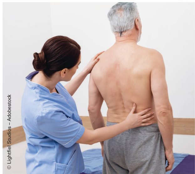
PhysiotherapeutInnen klären im Notfallzentrum insbesondere PatientInnen mit Wirbelsäulenproblemen ab. | Au service des urgences, les physiothérapeutes s’occupent essentiellement de patients atteints de problèmes rachidiens.

Wenn wie im Fallbeispiel sowohl Arzt als auch Physiotherapeut den Patienten untersuchen, so könnte ein Vorteil sein, dass der Fokus klarer definiert ist. Die Ärztin oder der Arzt konzentriert sich primär auf den Ausschluss von potenziell gefährlichen Pathologien, während die Physiotherapeutin oder der Physiotherapeut die Aufmerksamkeit hauptsächlich auf die Funktionsdiagnostik des Bewegungssystems richtet. Gewisse Redundanzen in der Erhebung der Anamnese und in der klinischen Untersuchung erhöhen dabei möglicherweise die Patientensicherheit. Das Mehr an Sicherheit kann zusätzliche Kosten verursachen, weil mehrere Berufsgruppen involviert sind. In die Gesamtbetrachtung sind auch Kostenersparnisse durch eine schnellere, gezieltere Behandlung,