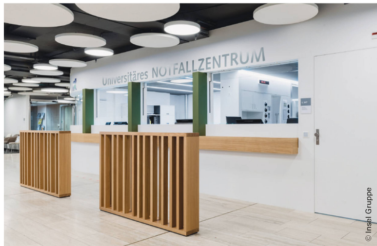
Das Pilotprojekt «Physiotherapeutischer Initialkontakt im Notfallzentrum» startete 2019 am Inselspital Bern. | Le projet pilote «Premier contact physiothérapeutique au service des urgences» a démarré en 2019 à l'Hôpital de l'Île à Berne.