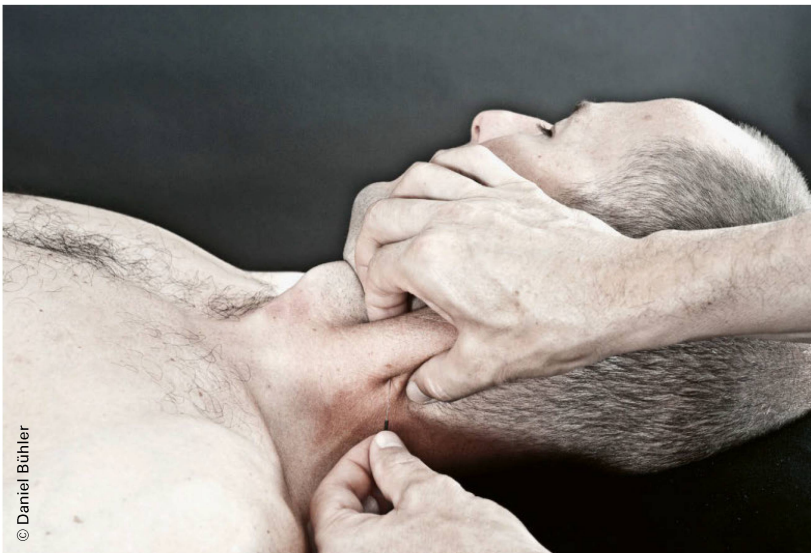
Abbildung 3: Dry-Needling-Behandlung des Musculus Sternocleidomastoideus. | Figure 3: Traitement de dry needling du muscle sterno-cléido-mastoïdien.

En cas de douleurs au niveau des cervicales, de la tête et de l'articulation temporo-mandibulaire, l'ensemble des muscles des épaules, de la nuque et de la mâchoire doit être examiné et traité. Tous les muscles traités par thérapie manuelle des points gâchettes ne peuvent pas être traités par dry needling en raison de leur anatomie ou de leur localisation. En cas de douleurs cervicales locales, les muscles les plus souvent traités par dry needling sont les