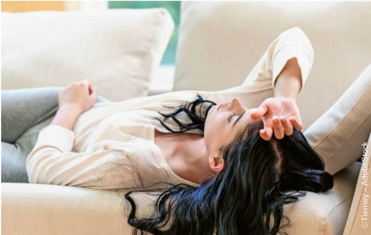
Abbildung 2: Crashes zeigen sich häufig erst nach der Physiotherapie, wenn die Patient:innen schon zu Hause sind. | Figure 2: Les crashes se manifestent souvent après la physiothérapie, lorsque les patient-e-s sont déjà rentré-e-s à la maison.

sein. Bei einer POTS steigt der Puls um über 30 Schläge innerhalb von zehn Minuten nach Einnahme einer aufrechten Position [4].