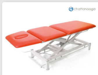
Table de thérapie Galaxy de Chattanooga Fiabilité et praticité pour ces tables de traitement.

SISSEL Portable Therapieliege Leicht, einfach zu transportieren und schnell auf- und abbaubar