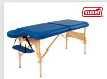
Table de thérapie portable SISSEL Légère, fonctionnelle avec grand confort d'utilisation

SISSEL Portable Therapieliege Leicht, einfach zu transportieren und schnell auf- und abbaubar