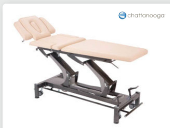
Table de thérapie Montane de Chattanooga Qualité supérieure pour ces tables stables, solides et fiables

Chattanooga Galaxy Therapieliege Zuverlässige und leicht zu bedienende Behandlungsliegen