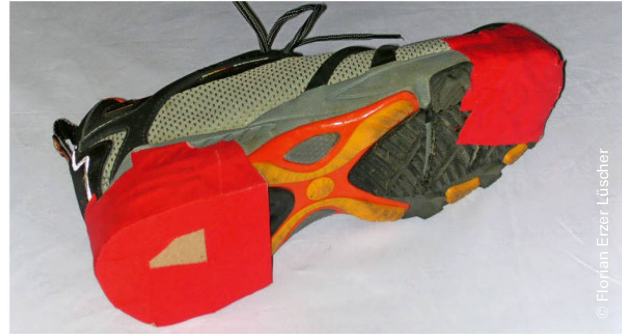
Abbildung 2: Mit Tapes lässt sich eine Korkplatte am Konfektionsschuh anbringen, um den Absatz zu erhöhen. Auch eine Gleitspitze kann so simuliert werden. | Illustration 2: Des bandes adhésives permettent de fixer une plaque de liège à la chaussure, afin d'augmenter la hauteur du talon. Cela permet aussi de simuler une pointe glissante.

physiothérapeutes doivent tenir compte de l'impact à long terme, contrôler régulièrement que le moyen auxiliaire est employé de manière correcte durant toute la durée d'utilisation. En cas de modification de la fonction du membre inférieur par exemple, ils-elles veilleront à le faire adapter. Il est en outre important que le moyen auxiliaire ne soit pas remis le dernier jour du séjour en clinique ou en rééducation, et que son utilisation soit étroitement encadrée par les thérapeutes dès le début.