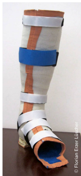
Abbildung 3: Eine Probeorthese (hier mit einem Korkabsatz) aus Soft- und Hardcast ermöglicht es, den Effekt einer möglichen Orthesenversorgung besser einzuschätzen. Illustration 3: Une orthèse d'essai (ici avec un talon en liège) en Softcast et Hardcast permet de mieux évaluer l'effet d'une éventuelle orthèse.

Zusammen mit den Orthopädietechniker:innen müssen sie den Schwerpunkt für die jeweiligen Patient:innen definieren und im Spannungsfeld von Zielen, möglichen Ressourcen und den bekannten Kontextfaktoren einen Kompromiss finden.