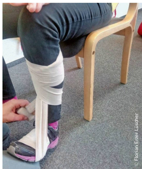
Abbildung 1: Anlegen eines Fusswickels. | Illustration 1: mise en place d'un bandage au pied.