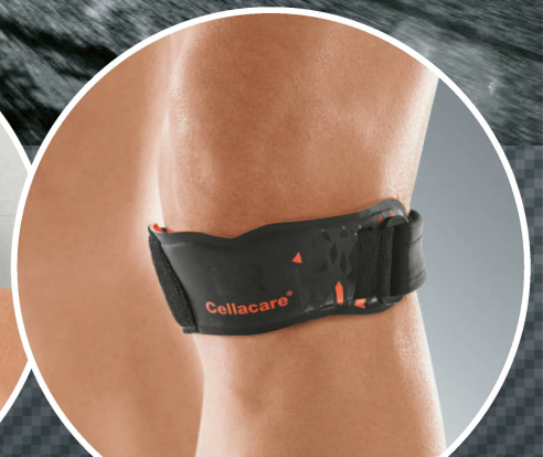
Cellacare® Patella Control Expert