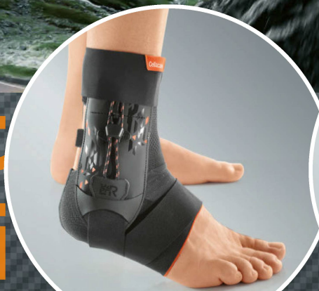
Cellacare® Malleo Control Expert

Orthèse pour la stabilisation de l'articulation de la cheville