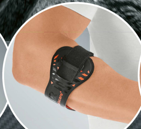
Cellacare® Epi Control Expert