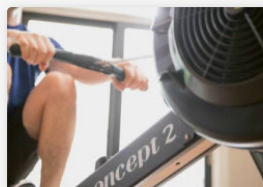
SPORT, FITNESS UND PILATES

ÉQUIPEMENTS ET INSTALLATIONS THÉRAPEUTIQUES