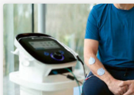
THERAPIEGERÄTE UND -EINRICHTUNGEN

ÉQUIPEMENTS ET INSTALLATIONS THÉRAPEUTIQUES