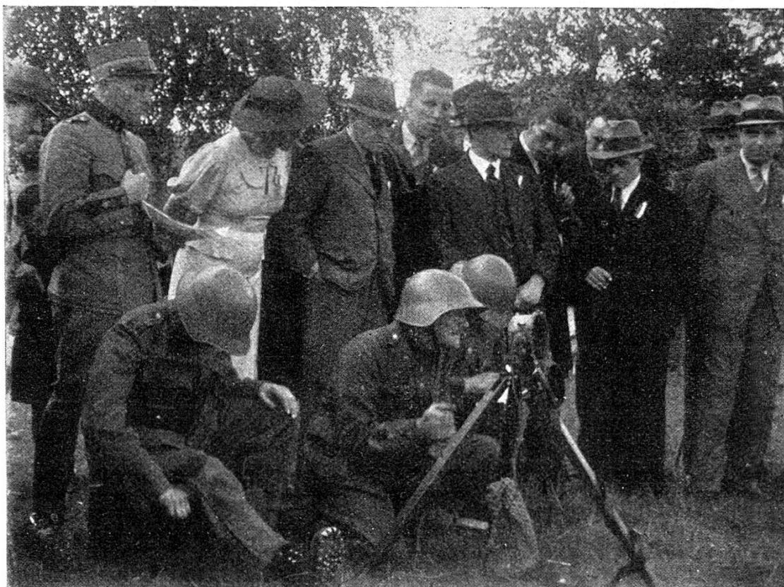
Sig. Patr. in Konkurrenz.