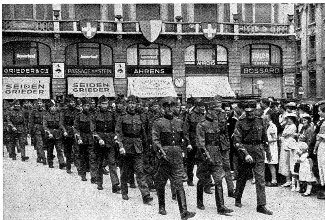
Die Sektion im Festumzug.