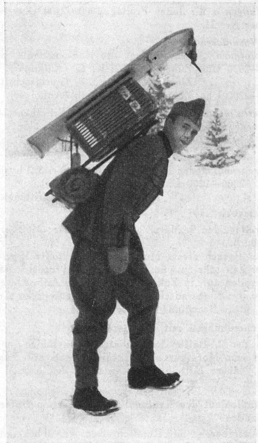
Fig. 3. Auf dem Alpweg.