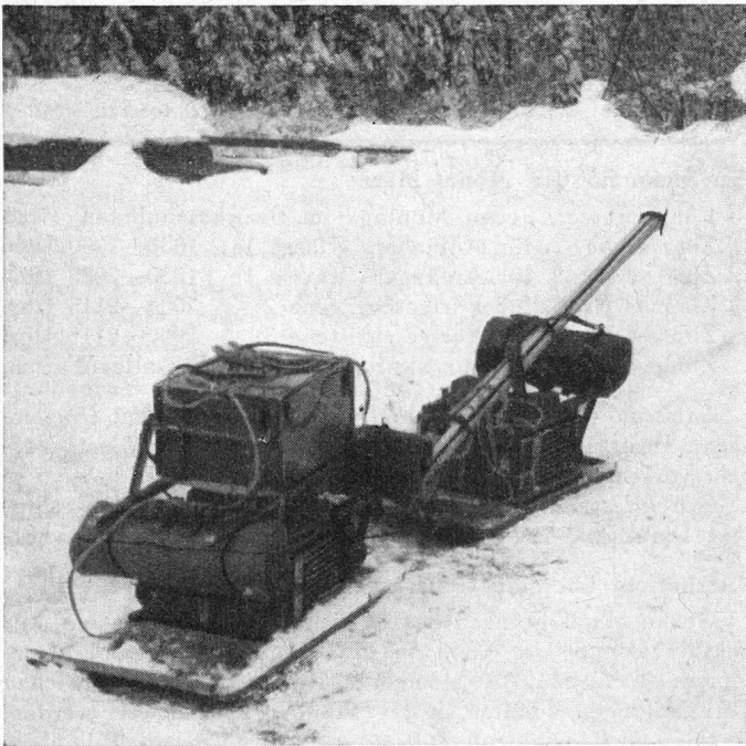
Fig. 1. Kriegsbereitschaft ausser Dienst. Die «Funkerschlitten» der Sektion Thun.

An 3 Abenden wurden Telegramme zwischen der Station im Kurslokal und einer zweiten Station in 300 m Entfernung ausgetauscht. Für die Morsekursteilnehmer war diese Übung eine willkommene Abwechslung.