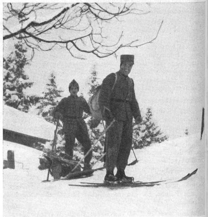
Fig. 4. Abfahrt.