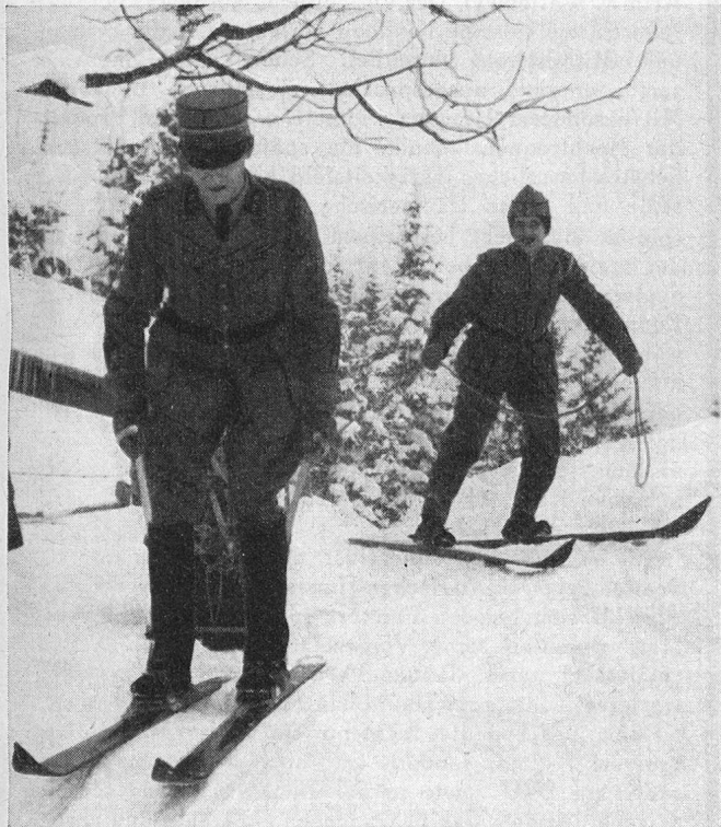
Fig. 5. Abfahrt mit Rückhaltseil.

Samstag, den 12. Februar. Besammlung 1350 Uhr im Bahnhof Thun und Abfahrt per Bahn nach Oey-Diemtigen im Simmental. Anschliessend Marsch auf der Talstrasse nach Horboden im Diemtigtal. Die Stationen wurden auf den Schlitten (Fig. 1 und 2) nachgezogen und die Ski getragen.