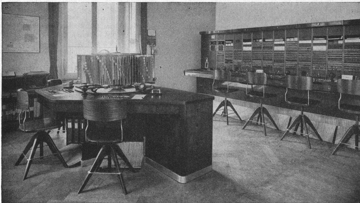
Fig. 1. Der Auskunftstisch des Fernamtes Chur.