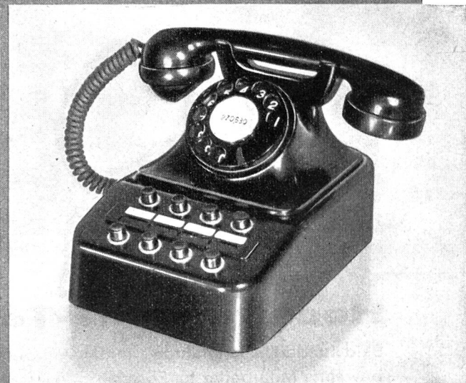
Kleine, kombinierte Direktions- und Sekretär-Tischstation für Amts-, Haus- und Querverbindungsleitungen.

VERTRIEB DURCH: SIEMENS ELEKTRIZITATS-ERZEUGNISSE A.-G., ZÜRICH, BERN, LAUSANNE