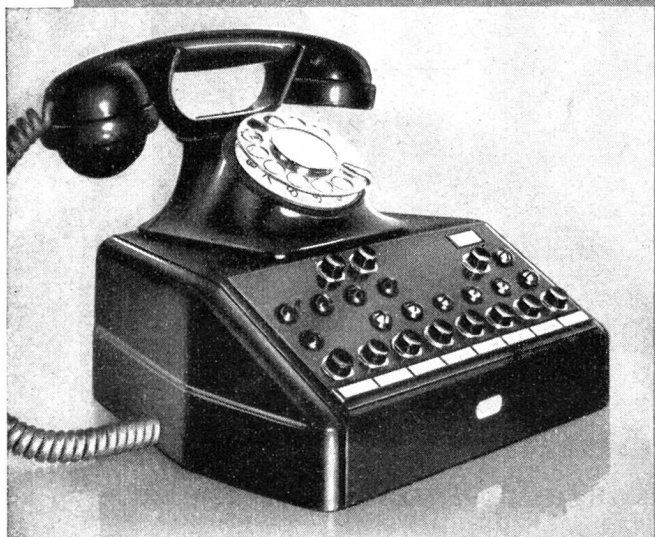
Große, kombinierte Direktions- und Sekretär-Tischstation für Amts-, Haus- und Querverbindungsleitungen.