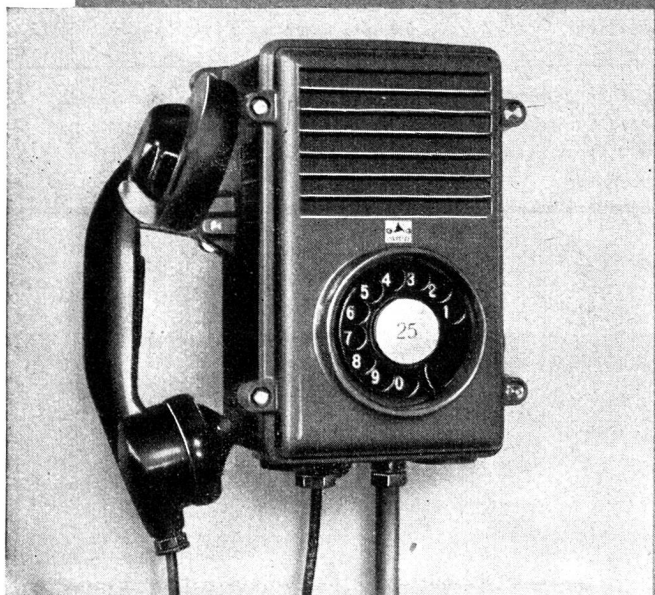
Feuchtigkeitsbeständige Wandstation für feuchte Räume und Freiluftbetriebe wie Bahnanlagen, Elektr.-Werke usw.