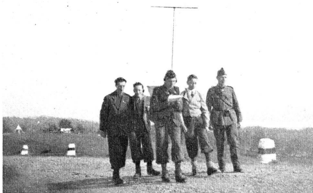
VI F 18 377