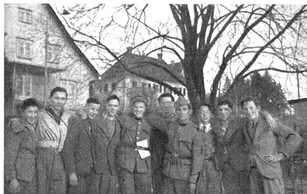
VI F 18 376

Der Ausmarsch zeigte uns Jungfunkern den Einsatz der Funkgeräte. Wir lernten, wie man über den Aether miteinander verkehrt. Wir genossen die angenehmen