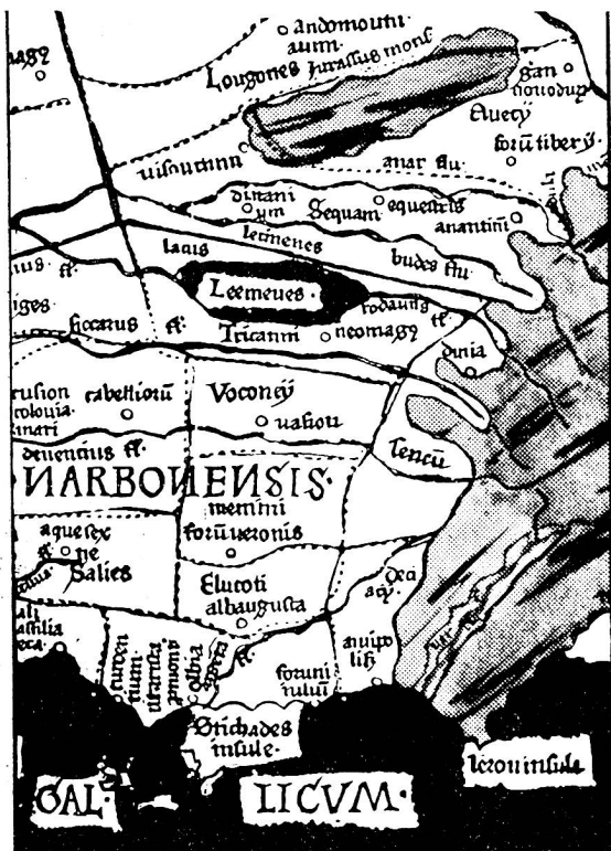
Ausschnitt aus der Gallia-Karte des Ptolemäus (Ulm 1482). Fragment de la carte Gallia de Ptolémée (Ulm 1482).

Im Mittelalter versuchten die Kartenmacher, die ihnen bekannte Welt in einen Kreis einzuzeichnen, und so ent-