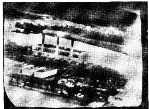
Ansicht eines Elektrizitätswerkes am Potomacfluss bei Washington, ferngesehen aus 1000 m Höhe mit einer «Block»-Televisionsanlage an Bord eines Flugzeuges. Das Bild wurde beim Empfang auf dem Erdboden vom Bildschirm eines Fernsehempfanggerätes aufgenommen.

Zwei verschiedenartige Typen solcher transportabler Fernsendsender wurden in gemeinsamer Arbeit der Radio Corporation of America , der National Broadcasting Co. und der nordamerikanischen Kriegsmarine entwickelt. Das «Block»-System eignet sich speziell für kleine Kampf- und Beobachtungsflugzeuge. Es besteht aus einer Sendeanlage mit einer einzigen Kamera, die meist an der Spitze des Aeroplans eingebaut ist und ohne jede Wartung betrieben wird. Der Pilot muss sein