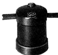
Nr. 9064 Nr. 9064 H (m. Aufhängehaken)