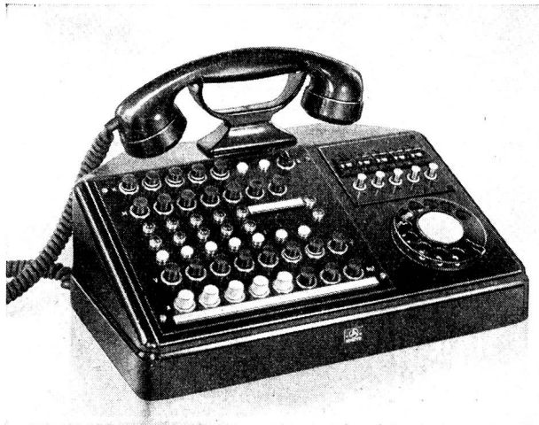
Vermittlungsstation für Telephonanlagen mit 5 Amtsleitungen.

Tausende von kleinen und grossen Betrieben der verschiedensten Branchen, haben uns bis heute mit der Planung und Erstellung ihrer Telephonanlagen betraut. Unsere erfahrenen Fachleute lösen auch Ihre Telephonprobleme zweckmässig und rationell unter Berücksichtigung der Eigenart Ihres Betriebes.