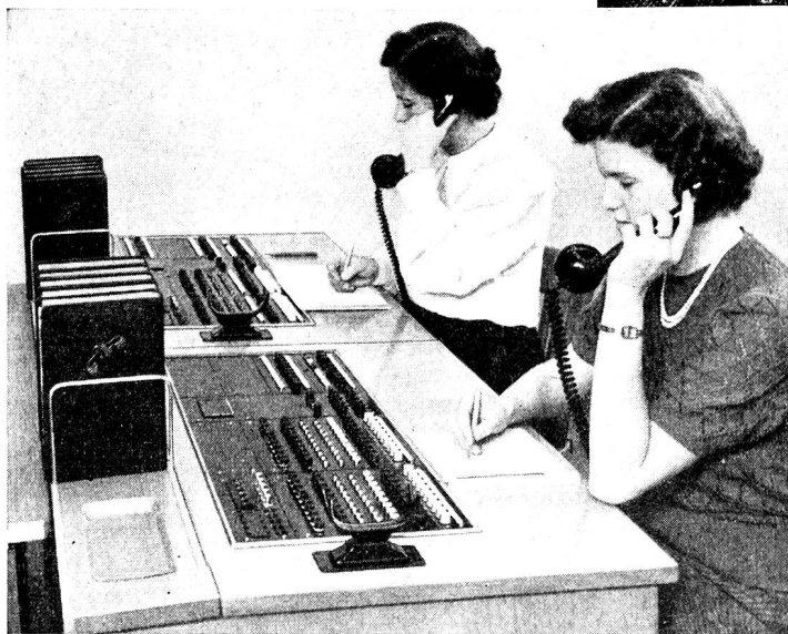
Neue schnurlose Vermittlungseinrichtung mit Zahlengabe für Telephonanlagen mit 20 Amtsleitungen.