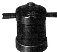
Nr. 9064 Nr. 9064 H (m. Aufhängehaken)