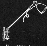
No. 9055 / 9050