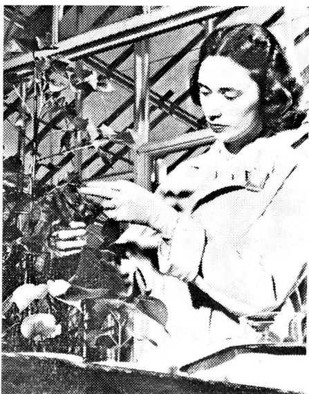
Die Nebenprodukte der Atomkraftherzeugung dienen mannigfaltigen wissenschaftlichen Forschungszwecken. Hier wird die Wirkung eines mit radioaktivem Phosphor durchsetzten Düngemittels auf Kulturpflanzen ermittelt.

nicht zu reden von den vielen tausend auswärtigen Besuchern, die täglich in die Konferenzstadt strömten, um durch Anschauungsunterricht etwas über das moderne Wunder der Atomspaltung zu lernen.