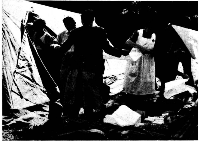
Der Militärsanitätsverein beim Aufbau des Operationszeltes