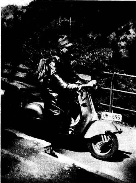
Eine motorisierte SE-101-Patrouille