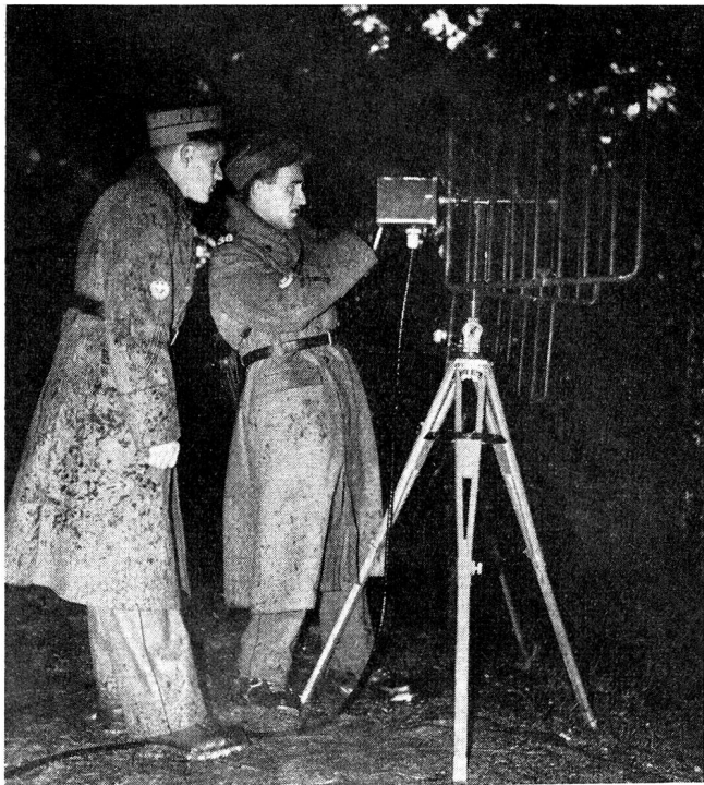
In strömendem Regen und bei einer Temperatur, die nur wenig über dem Nullpunkt lag, arbeiteten unsere Leute auf dem Pfannenstiel an der TL-D.

PTT zur Verfügung gestellten Material, vor allem aber dank der freudigen und ausdauernden Mitarbeit zahlreicher Mitglieder konnte sie trotz dem schlechten Wetter zu einem vollen Erfolg geführt werden. Der Einblick, den ein Besucher der Übung in das komplizierte und technisch verfeinerte Material und die Schwierigkeiten seiner Bedienung gewinnen konnte, legte die Notwendigkeit der ausserdienstlichen Weiterbildung der Angehörigen der Übermittlungstruppen klar vor Augen, sofern diese wichtige Truppengattung jederzeit kampftüchtig sein soll...»