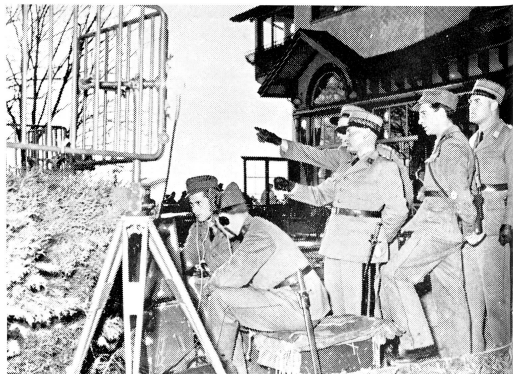
Am 21. März 1953, also ein Tag vor der DV in Zürich, führte der EVU seine erste gesamtschweizerische Übung durch. Verschiedene Sektionen erstellten ein Richtstrahl-Funknetz, das die historischen schweizerischen Hochwachten berührte. Aus diesem ersten Versuch, der überaus grossen Anklang fand, entstand der Wunsch, in vermehrter Masse unter der Leitung des ZV grossangelegte schweizerische Uebermittlungsübungen durchzuführen.