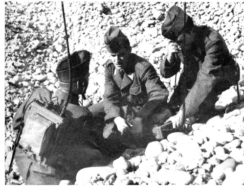
1954 war für den EVU ein besonders wichtiges Jahr. Nachdem sich im April eine Vereinigung der Fachgruppen des Brieftaubendienstes gegründet hatte, schloss sich diese nach kurzer Zeit dem EVU an. Die Delegiertenversammlung in Altdorf fasste zwei wichtige Beschlüsse: Gründung der Funkhilfe des EVU und Durchführung eigener Verbandswettkämpfe. Bereits am 1. Oktober 1954 stand die Funkhilfe mit 14 Gruppen einsatzbereit. Diese wertvolle Organisation hat in den folgenden Jahren einen weiteren Ausbau erfahren.