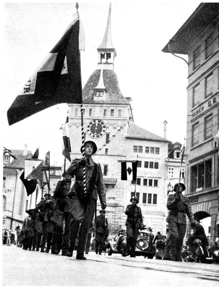
Am 19./20. April 1952 beging der Eidg. Verband der Uebermittlungstruppen das Jubiläum seines fünf- undzwanzigjährigen Bestehens. Zu diesem Anlass erschien ein Sonderheft des «Pioniers», der ebenfalls 25 Jahre alt geworden war. In diesem Heft wurde das erste Vierteljahrhundert des EVU und seines Verbandsorganes eingehend gewürdigt. Anlässlich des Jubiläums fand im Kursaal Bern ein Festakt statt, der die Delegiertenversammlung des nachfolgenden Tages im Berner Rathaus einleitete. Nach der DV marschierten die Delegierten mit den Fahnen ihrer Sektionen durch die Strassen Berns.