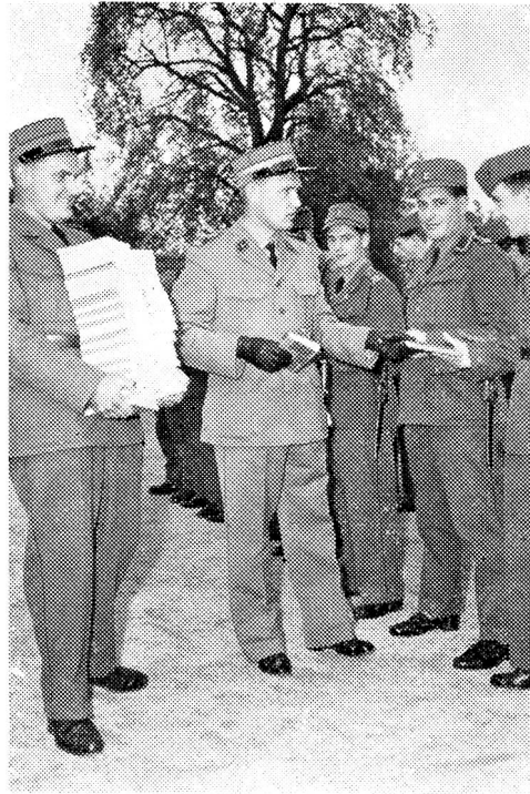
Beginn der Abgabe des Soldatenbuches

Auf diese Weise dürfen wir auch heute zuversichtlich daran denken, im Falle eines Krieges den Alpenraum zu halten und von dort aus die im Mittelland kämpfende Feldarmee zu unterstützen.