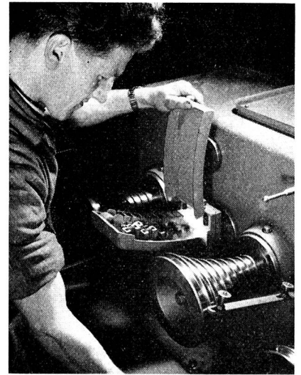
Das Verfeinern des Kupferdrahtes auf immer dünnere Drahtdurchmesser erfolgt in modernen Ziehmaschinen. Das Bild illustriert eine Feindrahtzieh-anlage, bei welcher der Kupferdraht durch kalibrierte Industriediamanten bis zu einem Drahtdurchmesser von 0,025 mm gezogen werden kann.

der meistverwendete Typ neben 14- und 28adrigen Kabeln enthielt sieben einadrige Leiter — veranlasste die Forscher, besonders seit der Einführung des Telephons, Kabel mit geringer Raumbeanspruchung herzustellen. Es gelangten in der Folge mit Harz, Wachs und Öl imprägnierte Faserstoffe (Jute, Hanf, Baumwolle, Papier) für die Aderisolierung der sogenannten Faserstoffkabel zur Verwendung, die sich, neben den um die Jahrhundertwende eingeführten Papierlufttraumkabeln, bis zum Ende des ersten Weltkrieges erhielten.