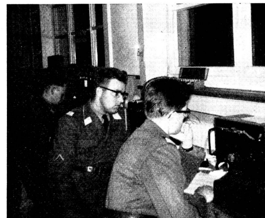
Oben: Einige Sektionen setzten im Rahmen von sektionsinternen Verbindungen neuste Geräte ein. In Solothurn war es eine SE-407, von deren Betriebsraum wir ein Bild zeigen. Mitte und unten: Zwei Schnappschüsse von der konzentrierten Arbeit im Zentrum Aarau.

Presse nicht lobend erwähnt werden musste. In verdankenswerter Weise hatte uns die Schulgemeinde Frauenfeld wieder die Räumlichkeiten der