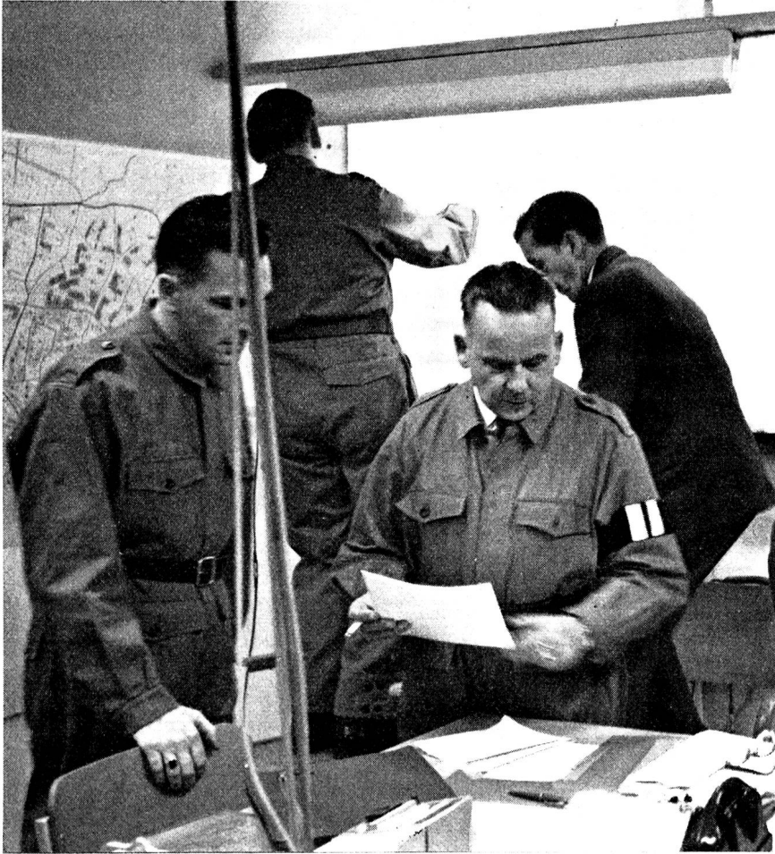
Der Ortschef in seinem Kommandoposten. Auf ihm ruht die grosse Verantwortung über Leben und Gut der Bevölkerung. Nur der beste Mann einer Gemeinde, der Vertrauen und Autorität nach oben und unten geniesst, ist dieser Aufgabe gewachsen, auf die er sich verantwortungsbewusst bereits im Frieden vorbereiten muss; auch er hat freiwillig und ausserdienstlich einen grossen Einsatz zu leisten.

an bekannten Geräten und in erlernten Funktionen eine ganze Reihe interessanter Aufgaben warten. Es darf erwartet werden, dass sich die aus der Wehrpflicht entlassenen Offiziere, Unteroffiziere und Soldaten dieser humanitären und sittlichen Verpflichtungen unserer Zeit nicht entziehen und, soweit sie nicht den Dienst im Selbstschutz im eigenen Heim oder am Arbeitsplatz vorziehen, sich verständnisvoll dem Alarm-, Beobachtungs- und Verbindungsdienst des örtlichen Zivilschutzes ihrer Gemeinde zur Verfügung stellen. Die Ortschefs werden dankbar sein, auf allen Stufen über in der Armee bewährter Mitarbeiter zu verfügen.