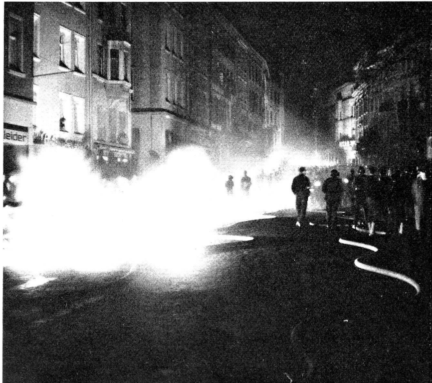
Jedes Jahr finden in unseren Städten verschiedene kombinierte Zivilschutzübungen statt, die der örtlichen Zivilschutzorganisation mit ihren Dienstzweigen Gelegenheit zur Zusammenarbeit mit den Luftschutztruppen bieten. Oben: Ausschnitt aus einer Übung in St. Gallen.

In diesem Zusammenhang stellt sich auch das Problem Wehrmann und Zivilschutz, das im Rahmen der Debatten um das kommende Zivilschutzgesetz mehrmals auftauchte und leider da und dort zu irrigen Auffassungen führte. Die hier geschilderte Bedeutung der Verbindung und Übermittlung im Zivilschutz lässt erkennen, dass den Angehörigen der Übermittlungstruppen nach ihrer Entlassung aus der Wehrpflicht im Rahmen der örtlichen Zivilschutzorganisationen