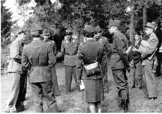
Flotter Einsatz bis zum Schluss: Letzte Weisungen an die Stations- und Gruppenführer vor dem Übungsabbruch im Nebenzentrum Zug.

Sektionsmitglieder, die die Rekrutenschulen absolvieren, Gelegenheit erhalten, ihr Können bei den Sektionskameraden demonstrieren zu können.