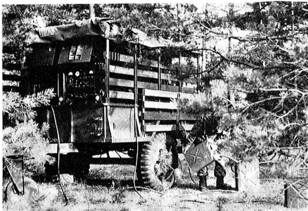
373 Das Aggregat zu einer Grossfunkstation.

Die drei Gruppenkommandos des Bundesheeres, geführt von einem Generalmajor, verfügen heute über 4 Jägerbrigaden und 3 Panzergrenadierbrigaden, verteilt auf den Raum der Standorte Wien, Steiermark und Oberösterreich. Die Gruppenkommandos verfügen zudem über die sogenannten Gruppentruppen, wie ein Versorgungsregiment, Artillerie, Vermittlungs- und Genietruppen. Dazu kommt auch ein Ausbildungsregiment, das personell und materiell zu einer Reservebrigade aufgefüllt werden kann. Zu den Luftstreitkräften zählen die