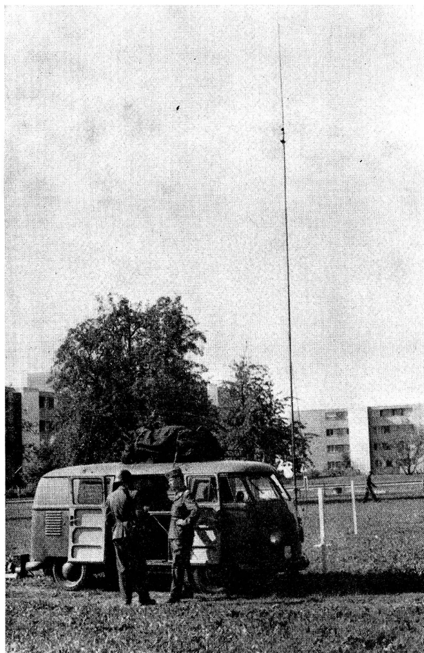
Die Mannschaft der Sektion Zug EVU bot im einheimischen Gelände eine beachtenswerte Leistung.

zur Abwicklung des vielseitigen Programms. Den Wettkampfgruppen der Telegraphenkompagnien war der Waffenplatz