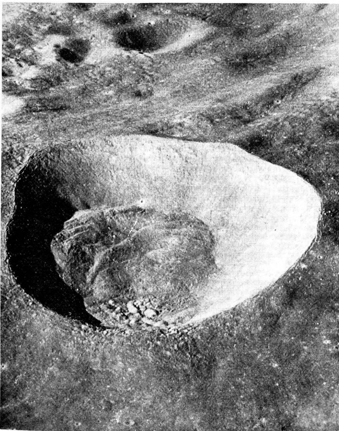
Bild 5. Typischer Mondkrater auf der Rückseite des Mondes, aufgenommen aus der Mondfähre von Apollo 10. Der Krater weist steile Wände und einen scharf geschnittenen Rand auf. Massen an eingebrochenem Material liegen am Boden, vermutlich dadurch entstanden, dass einmal Eiskrustenmaterial unter dem Einfluss der Erdgezeiten zerbrach, worauf er wieder zufror und mit Staub dicht bedeckt wurde. (Bild Amerika Dienst, Bad Godesberg Deutschland).

Die Maria sind ebenfalls noch Gegenstand verschiedener Theorien. Am wahrscheinlichsten ist die, dass diese gewaltigen und