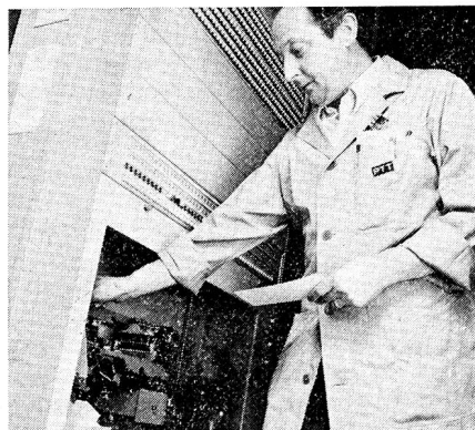
Der PTT-Fernmeldespezialist entnimmt dem Stanzer die Lochkarte

Kern des neuartigen Fehlererfassungssystems ist das Fehlerregister. Trifft eine Verbindung auf einen Fehler in einem der zahlreichen Stromkreise und Wegabschnitte des Durchschaltnetzwerkes, so verbindet sich die Steuerung sofort mit dem Fehlerregister. Das Fehlerregister hält fest, welche Anlageteile an der missglückten Verbindung beteiligt sind. Es gibt Nummer und Stellung der fraglichen Stromkreise an einen Stanzer weiter, der diese Daten zusammen mit Datum und Uhrzeit auf einer Lochkarte festhält. Das Steuerorgan löst in der Folge die unvollständig aufgebaute Verbindung aus. Es unternimmt sofort einen zweiten Versuch, die vom Teilnehmer gewünschte Verbindung über einen anderen fehlerfreien Weg im Durchschaltnetz herzustellen. Der ganze Vorgang dauert weniger als eine Sekunde und wird vom Teilnehmer nicht bemerkt.