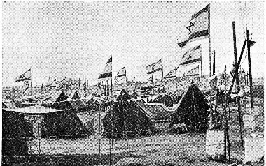
Ein ganz kleiner winziger Ausschnitt aus dem Marschcamp in Bet El

derjenige die Qual hatte, der wählen wollte. Eigentlich schade! Man hatte oft das Gefühl, weniger wäre mehr gewesen. Aber wenigstens ging es allen Teilnehmern so. Wer hätte es über sich gebracht, unserer Guide-Equipe, die sich so für alle von uns einsetzte und die Liebenswürdigkeit selbst war, auch nur eine Andeutung in dieser Richtung zu machen?