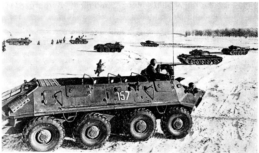
Chars et fantassins portés de l'armée soviétique lors de manœuvres

Ce dernier domaine revêt une importance particulière sur le plan de la dissuasion. En effet, l'Autriche et la Suisse constituent un corridor Est-Ouest d'une longueur de 800 km qui scinde en deux le dispositif de l'OTAN. Si la France cherchait, en cas de conflit en Europe, à se tenir à l'écart, l'OTAN se verrait contrainte pour assurer la liaison par la voie des airs entre ses secteurs Europe centre, où se trouve la masse de ses forces conventionnelles, et Europe sud, plus particulièrement l'Italie, de violer la neutralité de la Suisse ou de l'Autriche ou bien des deux pays. Cela ne manquerait pas d'appeler l'intervention des forces aériennes du Pacte de Varsovie qui pourraient aussi chercher à emprunter ce corridor pour prendre à revers les forces de l'OTAN. De telles manœuvres apparaissent d'autant plus vraisemblables que l'Autriche est incapable, vu l'état de sa défense aérienne, de s'y opposer. Il en résulte que la crédibilité de notre volonté de maintenir notre neutralité et de remplir les obligations qui en découlent, dépend dans une large mesure de l'efficacité de notre défense aérienne.