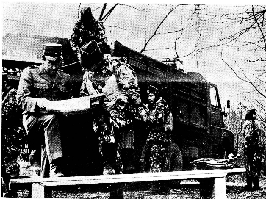
Letzte Vorbereitungen vor einer Uebersetzübung der Pontoniere

stellung des in Freiheit und Wohlstand heranreifenden Bürgers und der im Militär nicht zu umgehenden Pflichterfüllung und Auftragsstreue ausgesetzt. Die Einsicht in den spezifischen Charakter einer militärischen Ordnung zu vermitteln, ist eine der anspruchsvollsten Aufgaben des Instructors. Ihn darin zu unterstützen, sollte ein Anliegen aller unseren Staat tragenden Kräfte sein. Denn die Tätigkeit des Instructors ist für unsere Armee von unschätzbarem Wert. Wenn wir also von einer Sicherheitspolitik der Schweiz sprechen, in der die Armee eine bedeutende Stellung einnimmt, so sollte nie vergessen werden, dass für die Ausbildung dieser Armee letzten Endes 1400 Leute zuständig sind, die des Vertrauens und der Unterstützung der Öffentlichkeit bedürfen.