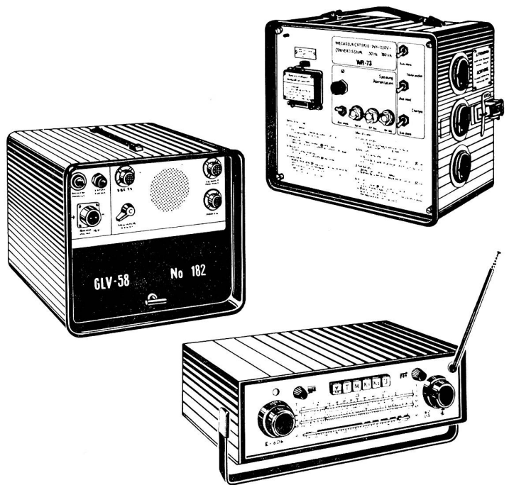
Allwellenempfänger Kraftverstärker Wechselrichter Prüf- und Messgeräte.

Ausgereifte Geräte von der velectra sa bienne