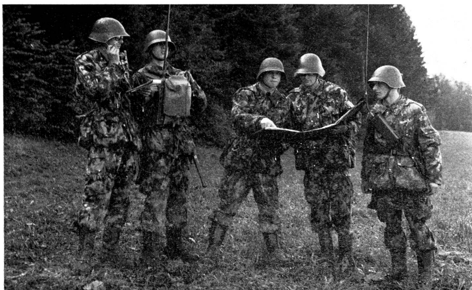
Der Kompaniekommandant mit der Kommandogruppe SE-206 in Verbindung mit der vorgesetzten Stelle und SE-125-Verbindung mit den Gefechtszügen

Mit dem Befehl des Oberbefehlhabers der Schweizerischen Armee General Guisan vom 24. April 1945 wurde kurz vor Ende der Mobilmachungszeit die so lange erwartete Nachrichtenkompanie geschaffen. Diese Einheit fasst nun alle Spezialisten wie Motorfahrer, Nachrichtensoldaten, Telefonisten und Funker des Führungs- und Nachrichtenapparates des Infanterie-Regi-