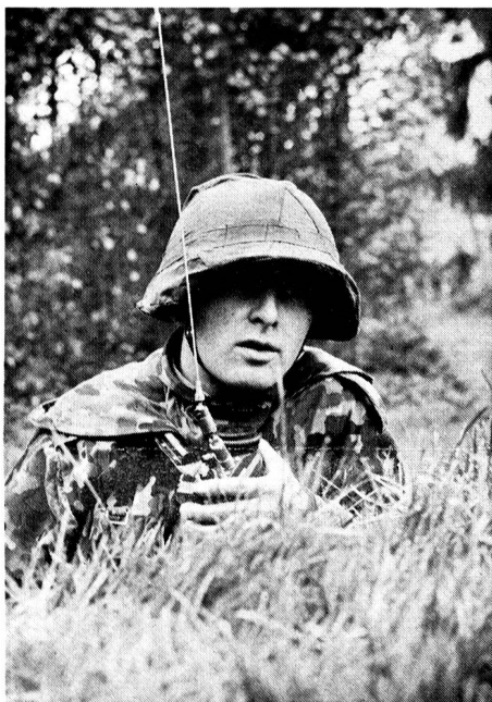
Die Gefechtsordnanz des Zugführers in Verbindung mit dem Kompaniekommandant mit der Station SE-125

Bereits 1924 wurde der Uebermittlungsdienst der Infanterie erweitert und zu den Telefonisten gesellten sich die Signalsoldaten der Infanterie. Welche mit der Signallampe und den Signalflaggen «Depeschen» mit Morsezeichen übermittelten. Rekrutenschulen für Telefon- und Signalpatrouillen