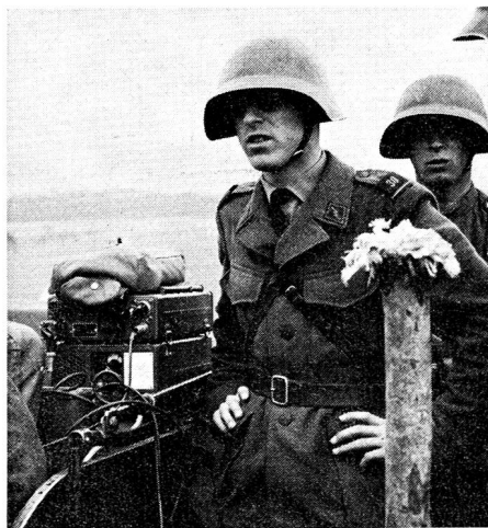
Der Bataillonskommandant mit seiner Begleitfunkstation im Bataillons-Führungsnetz TO-61; SE-206, die ersten voll motorisierten Stationen

nützer es gestatten, Draht und Funk miteinander zu betreiben und auszunützen. Ein Kommandant, der in einer Situation nur noch über seine persönliche Begleitfunkstation verfügt, muss mit seinem Vorgesetzten, Untergebenen oder Nachbar sprechen können, der im selben Moment nur noch über eine Telefonverbindung verfügt. — Hoffen wir auch, dass bald einmal die grosse Lücke im Befehls- und Nachrichtenapparat, nämlich die sichere und automatische Sprachverschleierung, wo der Uebermittler mit der Verschleierung selber nichts mehr zu tun hat und der Inhalt der Uebermittlung durch das Tarnverfahren nicht mehr entstellt wird, geschlossen werden kann.