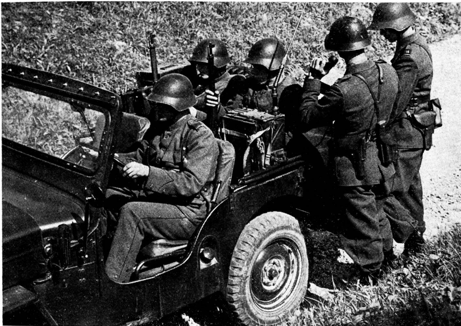
Die erste Begleitfunkstation des Bataillonskommandanten im Regiments-Führungsnetz mit dem Lux-Funkgerät

mentes zusammen. Im Bericht an die Bundesversammlung über den Aktivdienst schrieb General Guisan auf Seite 93: «...Es wird auch ihr Ziel sein müssen, unsere Infanterie beweglicher zu machen, indem man ihr motorisierte Transportmittel gibt, zum mindesten für Tornister und das Material, und indem man ihre rudimentären Uebermittlungsmittel ersetzt durch allgemeine Verwendung von Funkgeräten bis hinunter zur Einheit und zum Zug.»