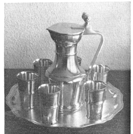
Wanderpreis der Sektion Thurgau

Der Stelzenhof wird ja bald zu unserer zweiten Heimat; versammelten sich doch bereits am Chlaushock so an die fünfzig Uebermittler und Angehörige im gemütlichen Sáli am Cheminée-Feuer. Der Samichlaus zeigt sich von seiner besten Seite, obwohl einige kleine EVU-Sprösslinge dies bis zum Schluss nicht recht glauben konn-