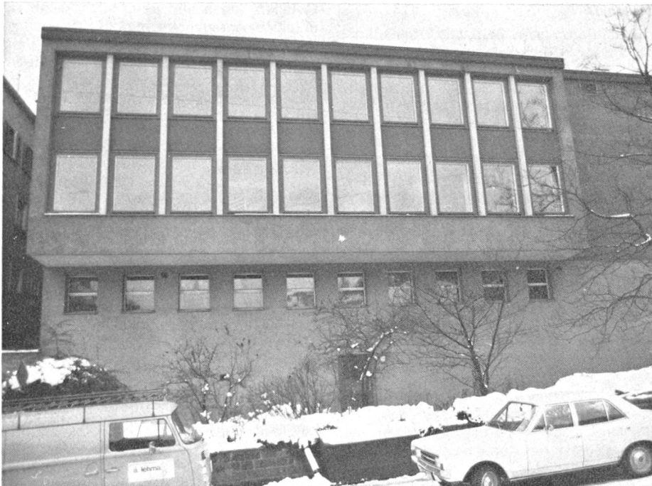
Ein neues Sendelokal in St. Gallen: Blick auf die Ostfront des Kirchengemeindehauses St. Mangen. In der Bildmitte ist der Eingang zu erkennen.

Ein weiterer Faktor bildete auch das Basisnetz SE-222/KFF . Jeden Mittwoch herrschte Hochbetrieb an den Geräten. Es war aus Platzgründen einfach nicht möglich, dass jedes anwesende Mitglied voll auf seine Rechnung kommen konnte. Ich bin überzeugt, dass dies der Grund war, weshalb immer weniger Kameraden an den Sendeabenden teilnahmen. Auch baulich blieb beim alten Lokal vieles zu wünschen übrig. Abende, die der Zusammengehörigkeit, der Kameradschaft dienen sollten, waren aus diesem Grund einfach nicht möglich. Es fehlte an Gemütlichkeit.