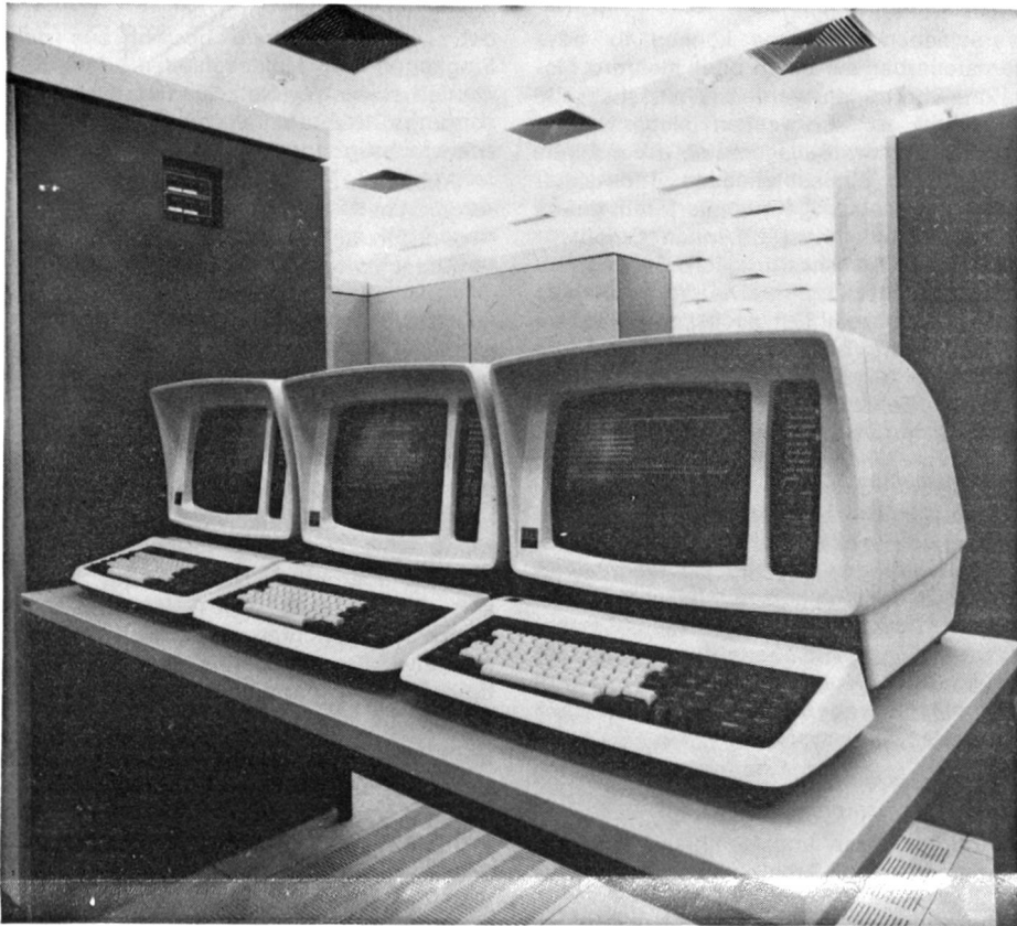
ITT Bildschirm-Terminals, die in der Robocom-Empfangszentrale als Bedienteil eingesetzt sind. Alarm und Steuerbefehle werden über fixgeschaltete Mietleitungen des Telefonnetzes übertragen. Jedem Alarm kann ein Text zugeordnet werden.