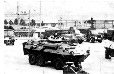
Blick auf die Fahrzeug- und Waffenschau in Schaffhausen: Im Vordergrund ist der Mowag-Radpanzer sichtbar.

ansteigt und heute um die 380 liegt. Die GMMSH pflegt ein gutes Einvernehmen mit andern militärischen Verbänden.