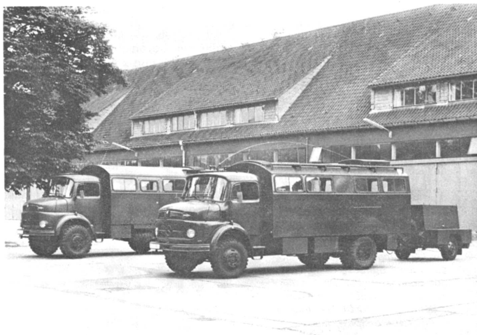
Im Vordergrund Einheitsfunkwagen Typ E mit Aggregat und im Hintergrund Funkvermittlungsfahrzeug L (UKW)

Pro Jahr erfolgen an der Schule für Fernmeldewesen etwa 19 Lehrgänge mit rund