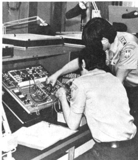
Die Arbeit am Grundlagen-Uebungsgerät bei der Ausbildung des fernmeldetechnischen Personals

sp. Im Gegensatz zu der Schweiz verfügt die Bundesrepublik Deutschland seit langem eine eigene Polizei des Bundes, auch wenn der Name Bundesgrenzschutz (BGS) nicht direkt darauf hinweist. Immerhin lassen sich Ziele und Aufgaben mit der geplanten schweizerischen Bundessicherheitspolizei (Busipo) vergleichen. Im Gegensatz zur schweizerischen Lösung ist aber der Bundesgrenzschutz eine personell und materiell selbständige Organisation und stellt nicht auf die Polizeien der Länder ab. Der Bundesgrenzschutz unterhält eine eigene Schule. Im nachfolgenden Artikel zeigen wir neben Aufgaben und Ausbildung des Bundesgrenzschutzes die Schule für Fernmeldewesen.