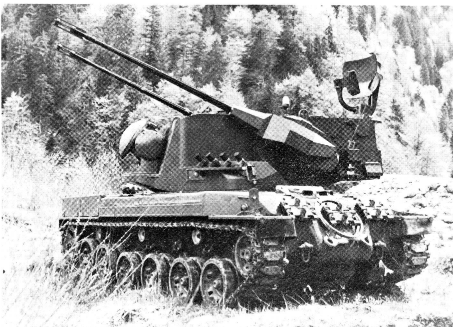
35 mm Flabpanzer Oerlikon-Contraves mit Fahrgestell des Schweizer Panzers 68

Dieses autonome und mobile Fliegerabwehrsystem wird unter anderem mit zwei 35 mm Oerlikon-Fliegerabwehrkanonen, einer Contraves-Feuerleitanlage sowie mit Siemens bzw. Siemens-Albis Radargeräten ausgerüstet sein.