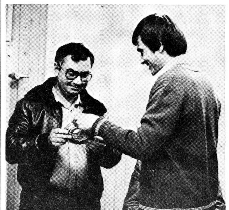
Der Präsident überreicht seinem 5 Jahre ausharrenden Amtsvorgänger einen Zinnteller zum Dank für seine zehnjährige Vorstandstätigkeit.