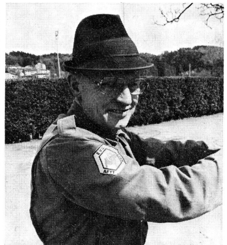
Wenn dieser Lenzburger kein Profi ist...

Lasst Bilder sprechen... vom Einsatz zugunsten des Eidg. Schützenfestes in Luzern. RR 3