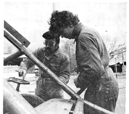
Leitungsbau Eidg. Schützenfest in Luzern: Auch die Bedienung einer Feuerwehrlinse wird von den Berner Kameraden in Luzern instruiert

Jeden Freitagabend ab 20.30 Uhr, Restaurant Löwen, Bern. am