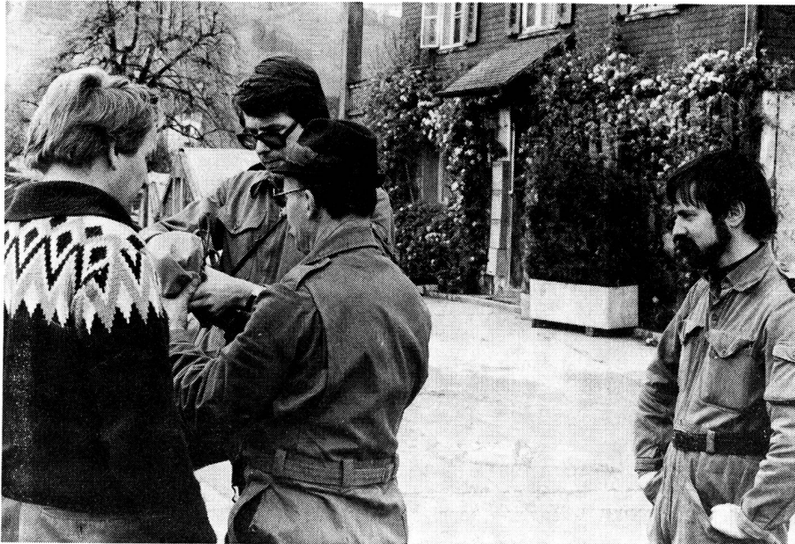
Leitungsbau für das Eidg. Schützenfest 1979 in Luzern: Im Feld weiss Imfeld bestens Bescheid, da staunt auch der Mot Fahrer ... (Sektion Lenzburg)