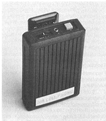
Als Taschen-Funkempfänger für das «Air Call Paging» wird der Funkrufempfänger der Firma NEC eingesetzt.