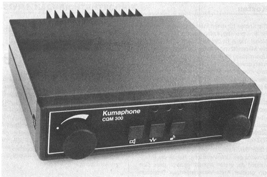
Mobiles Sprechfunkgerät KUMAPHONE CQM 300 Emetteur-récepteur mobile KUMAPHONE CQM 300