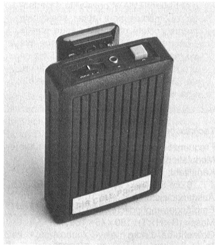
Als Taschen-Funkempfänger für das «Air Call Paging» wird der Funkrufempfänger der Firma NEC eingesetzt.