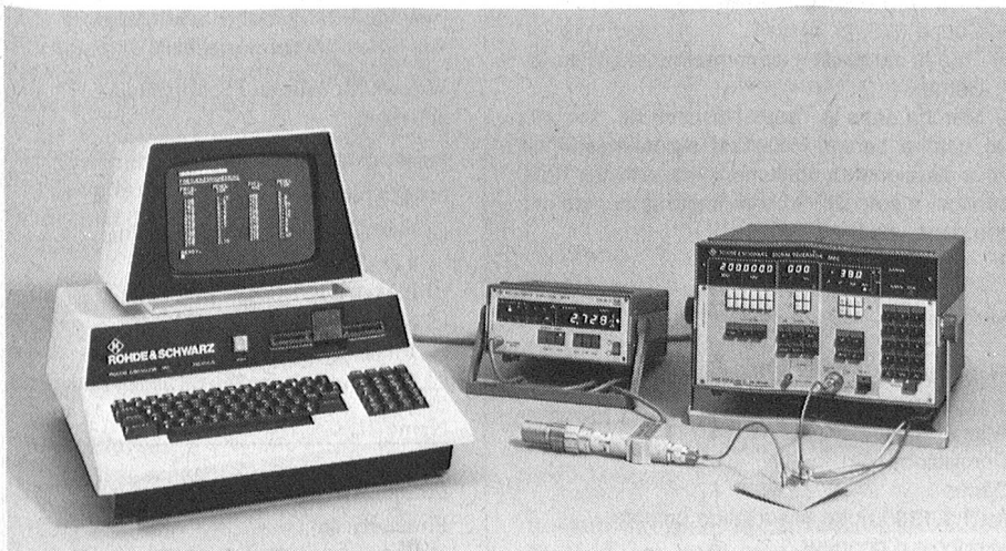
Der Process Controller PPC von Rohde & Schwarz ist ein Tischrechner, der alle Eigenschaften aufweist, die für normgerechte IEC-Bus-Steuerung sowie für schnelle und bequeme Bedienung erforderlich sind.