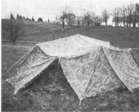
Mit diesem aus Blachen zusammengesetzten Armeezelt schützte eine Stationsmannschaft die Übermittlungsgeräte vor den unerwünschten Regengüssen.

nahm der Pontonierverein das Angebot an, und die darauf erfolgten Abklärungen ergaben, dass die Drahtverbindungen zwischen dem Festzelt und dem «Zentrum» benötigt werden, nämlich zwei für Telefone und eine für Lautsprecher. Somit verlegte man am Vorabend des Fest- und Wettkampfbeginnes die drei F-2-Drahtverbindungen über eine Distanz von etwa 700 Meter dank der Erfahrung, welche man beim Bau an der IMARO (Internationale Modellbahnausstellung, Rorschach) erworben hatte, innert kürzester Zeit.