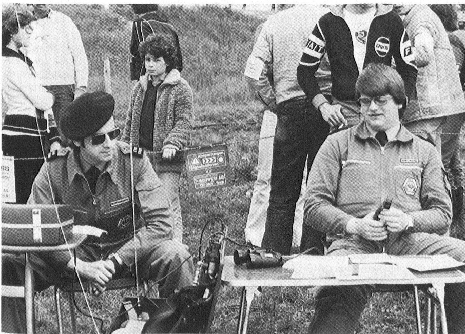
Sektion Thun: «Die Verbindungen haben die Probe bestanden.»

Rund 600 Franken an Mitgliedbeiträgen stehen leider noch aus. Ein Veteranenmitglied sowie 15 Aktiv- und 8 Jungmitglieder versäumten bis zum Redaktionsschluss, ihren Obulus zu entrichten. Du gehörst doch wohl nicht dazu, Ka-