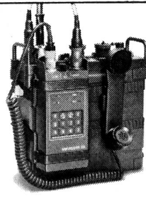
Sprachchiffriergerät GRETACODER 210

Auch geniale militärische Operationen werden durch ungesicherte Übermittlung wirkungs- und wertlos. Die verschlüsselte Weitergabe vertraulicher oder geheimer Informationen ist eine der Voraussetzungen für militärischen Erfolg. Mit GRETACODER chiffriert, sind Ihre Informationen vor unbefugten Zugriffen und Manipulationen absolut sicher.