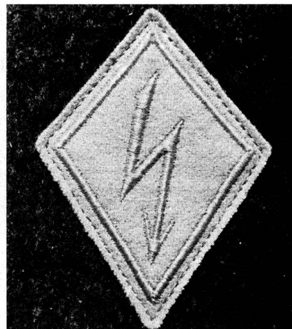
La couleur des parements est d'importance mineure.

Les liaisons par courriers et pigeons-voyageurs sont encore d'actualité. Les courriers sont engagés à tous les échelons de commandement. Il y a les courriers normaux et les courriers spéciaux qui sont utilisés suivant les besoins.