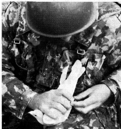
«Prise de liaison» avec pigeons-voyageurs.

Chaque commandant tactique porte la responsabilité du service de transmission dans sa sphère de commandement. Des points renforcés peuvent être créés pour répondre aux objectifs du chef tactique ou opérationnel. Les efforts en matière de liaison sont réalisés par la superposition de divers moyens de transmission, par exemple par la conduite multiple de liaisons et par l'engagement de moyens particulièrement efficaces. Chaque organe de commandement prend, dans sa zone, les mesures de protection électroniques nécessaires.