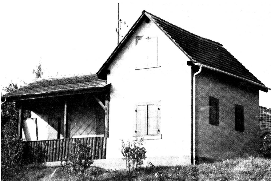
Das EVU-Hüsli der Sektion Schaffhausen strahlt in neuem Glanze.

Schon wieder neigt sich ein Jahr dem Ende entgegen. Ich möchte die Gelegenheit benüt-