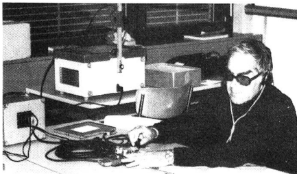
Istruttore impugnani al lavoro

Il comitato centrale, durante la seduta del 30.10.81 ha deciso di raccomandare a tutti i soci che volessero munirsi, privatamente, di una installazione videocassette, il sistema VHS se esiste l'idea di base di voler usare il tutto per l'ASTT. Così si faciliterebbe lo scambio delle cassette.